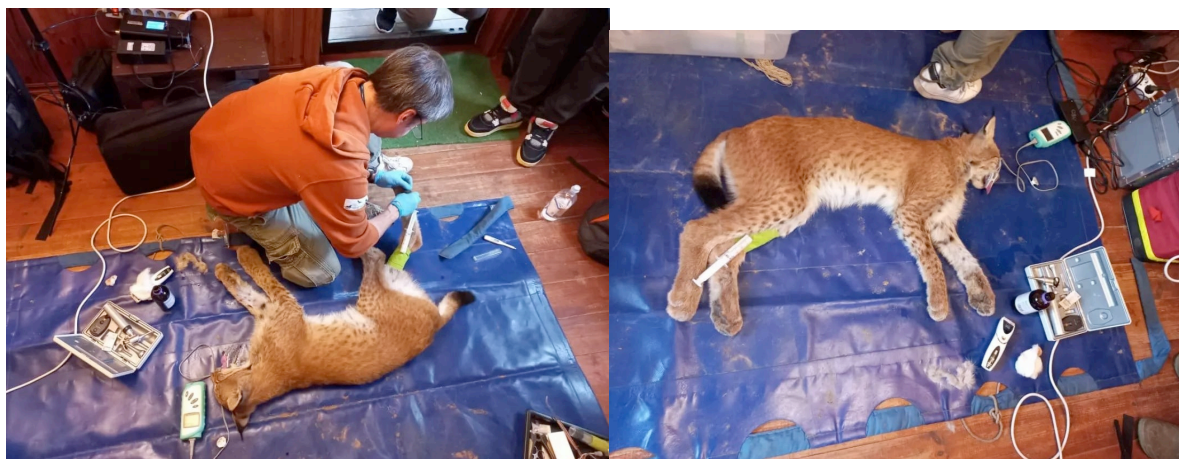
Рис. 1,2. Обследование рыси. Блага.

17 сентября 2022г. проведено комплексное медицинское обследование ( выявление скрытых болезней, наличие инфекций) рыси Блага. Блага оказалась абсолютно здоровой и была переведена в реабилитационный вольер .