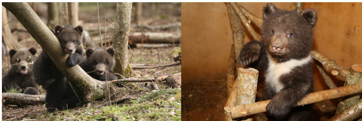
Рис. 1,2. Медвежата бурого медведя в Центре спасения медвежат-сирот

Команда Госпиталя осуществляет ветеринарное сопровождение деятельности АНО по сохранению животного мира «Центр спасения медвежат-сирот» (Тверская область). Проведены медицинские осмотры с забором необходимых анализов поступивших медвежат в АНО «Центр спасения медвежат-сирот», куда ежегодно попадает из природы от 8 и до 16 медвежат бурого медведя, оставшихся по разным причинам без матери.