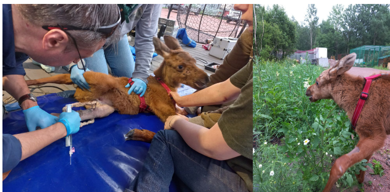
Рис. 1,2. Лосенок

10-13 июля 2022г. ветеринарными специалистами Госпиталя было проведено обследование травмированного лосенка. По результатам обследования назначено медикаментозное лечение.