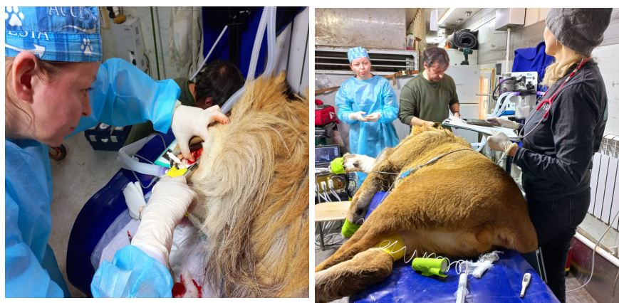
Рис. 1. Стоматологическая операция. Гром.

1. Лев Гром (Цирк Династии Довгалюк (ИП Довгалюк Н.Н., 05 февраля 2022г.): в результате гнойного воспаления зуба у животного образовался абсцесс и свищ на челюсти. Для исключения возможных серьезных осложнений здоровья животного была проведена стоматологическая операция. Анестезию и оперативное вмешательство Гром перенес без осложнений. Последующее наблюдение за состоянием Грома подтвердило его стабильное состояние и значительное улучшение самочувствия.