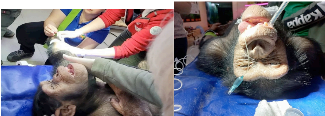
Рис. 1,2. Стоматологическая операция .Шимпанзе