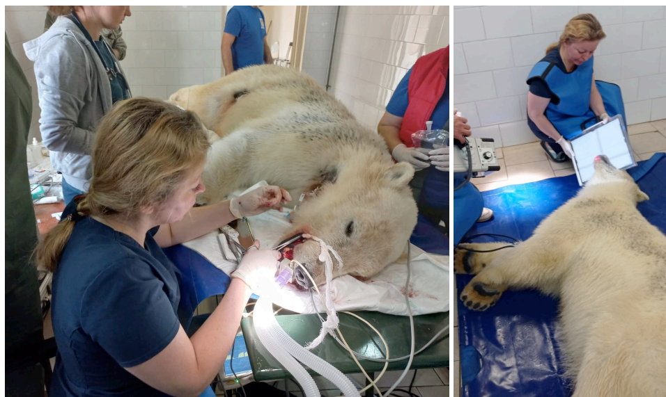
Рис. 1,2. Стоматологическая операция . Самка белого медведя

6. Белый медведь, самка (Муниципальное автономное учреждение культуры "Ростовский-на-Дону зоопарк", 01 июня 2022г.): проведен клинический осмотр животного, взяты все необходимые материалы для исследования, сделана рентгенография. Животному было проведено пломбирование зубов, сделана пластика десны после травмы.