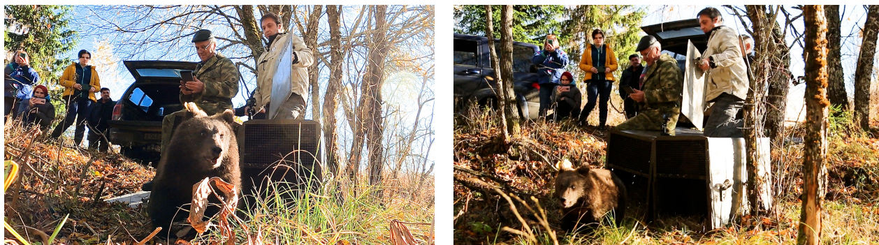
Рис. 1,2. Медвежата бурого медведя Ежик и Веснушкин

7. 10 октября 2022 г. специалисты Госпиталя приняли участие в выпуске двух медвежат 2022 года рождения (Ежик и Веснушкин), который состоялся на территории охранной зоны ФГБУ «Центральнолесной государственный природный биосферный заповедник».