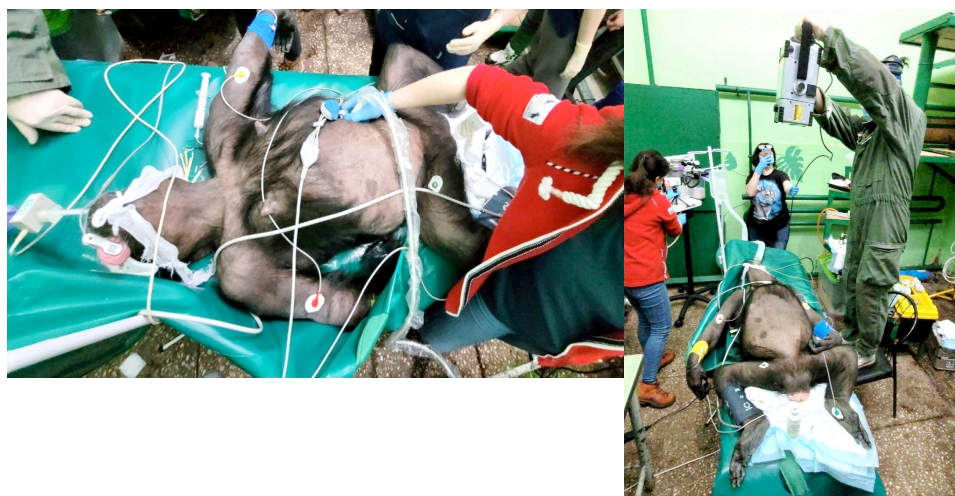
Рис. 1,2. Обследование шимпанзе

3. Шимпанзе (зоопарк г.Челябинск – МБУК «Зоопарк», 20 апреля 2022г.): животное более трех лет имеет диагноз «сахарный диабет 1-го типа». Животному было проведено плановое ветеринарное обследование, по результатам которого была проведена коррекция схемы лечения.