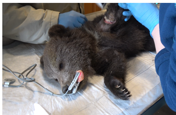
Рис. 1,2 Травмированный медвежонок Веснушкин

4. 20-21 июня 2022г. проведен плановый осмотр всех находящихся в Центре медвежат. Особое внимание - Веснушкину. Было проведено рентген-обследование травмированной лапы, взяты анализы крови. Появилась надежда, что лапку можно сохранить. Чувствительность в лапе медленно, но возвращалась. Специалисты Центра спасения медвежат-сирот делали все, чтобы Веснушкин вернулся в природу полноценным и здоровым медведем.