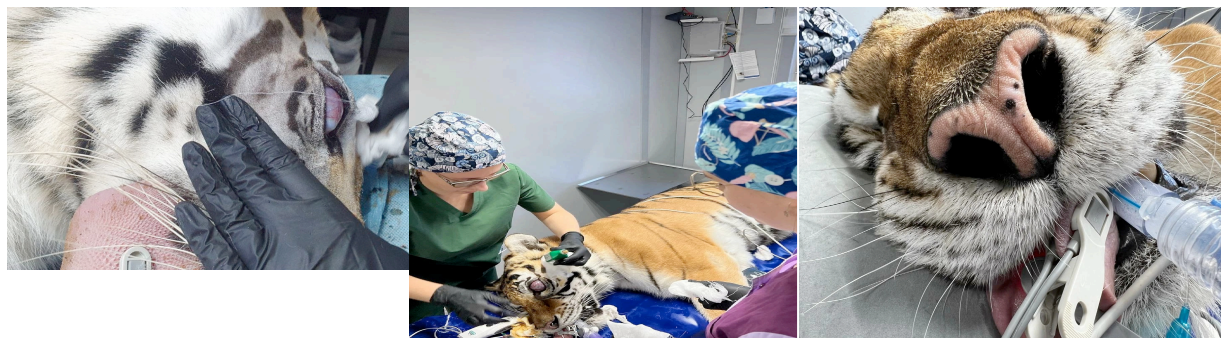
Рис.1,2,3. Офтальмологическая операция. Аврора

6. Самка тигра Аврора поступила в Хоспис для больших кошек «Дом Тигра» с глаукомой в терминальной стадии обоих глаз. Зрение тигрица потеряла уже давно, испытывала сильные боли. В октябре 2022г. была проведена операция по удалению одного глаза, в декабре – другого. Осложнений после операций нет.