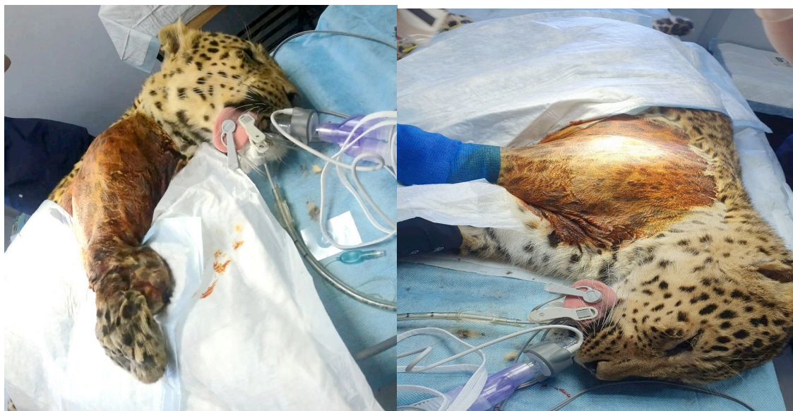
Рис. 1,2. Операция Бетти

6. Самка тигра Аврора поступила в Хоспис для больших кошек «Дом Тигра» с глаукомой в терминальной стадии обоих глаз. Зрение тигрица потеряла уже давно, испытывала сильные боли. В октябре 2022г. была проведена операция по удалению одного глаза, в декабре – другого. Осложнений после операций нет.