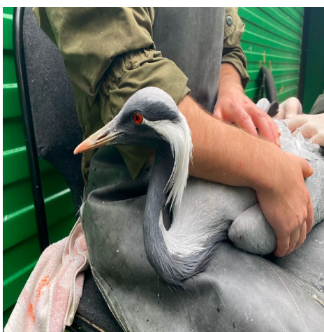
Рис. 1. Журавль красавка

В рамках таких проектов мы постоянно сотрудничаем с Питомником по разведению редких видов журавлей и Зубровым Питомником Окского Заповедника. С 01.10.2022г. по 04.10.2022г. специалистами Госпиталя была проведена ежегодная диспансеризация птиц (более 60 птиц), в ходе которой был проведен ветеринарный осмотр, УЗИ и рентген-исследования, взяты образцы крови для проведения анализов, проведено исследование экскриментов на наличие паразитов. Результат диспансеризации показал, что все птицы здоровы.