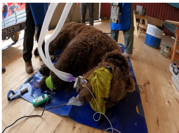
Рис. 1. Мансур

20 июля 2022г. в связи с ухудшением состояния (хроническая рвота) медведя Мансура было проведено комплексное гастроскопическое обследование, включая рентгенографию, УЗИ-исследование, эндоскопию, также были взяты образцы крови и экскрементов для проведения анализов. По результатам обследования была назначена схема лечения. Животное перенесло анестезию без осложнений.