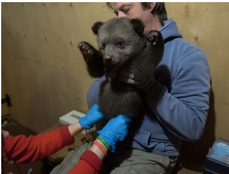
Рис.1 Медвежонок бурого медведя в Центре спасения медвежат-сирот

2. 25-27 апреля 2022 г.: плановый ветеринарный осмотр 13-ти медвежат без применения седации, вакцинация против бешенства, обработка от паразитов.