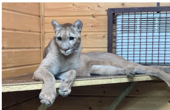
Рис. 1. Дакота

2. Ветеринары Госпиталя осуществляют регулярный мониторинг здоровья пумы Дакоты, которая находилась на попечении Фонда и 16.10.2022г. была передана в Дом Тигра для проживания в условиях, приближенных к естественным.