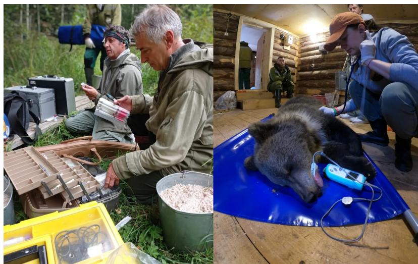
Рис.1,2 Обследование медвежат

5. 28-20 августа 2-22г. проведено медицинское обследование группы медвежат перед выпуском в естественную среду обитания (АНО «Центр спасения медвежат-сирот»). Обследование включало в себя: рентген, анализ крови, установка чипа и ушной метки, взвешивание, осмотр глаз, ушей, полости рта, замеры параметров тела, пальпация.