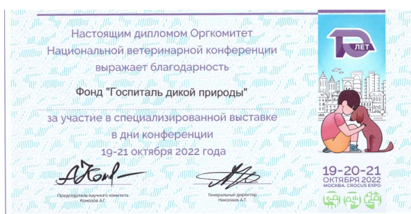
Рис. 1. Диплом Национальной ветеринарной конференции

Группа ветеринарных врачей Госпиталя дикой природы приняла участие в ежегодной юбилейной национальной ветеринарной конференции NVC 2022, которая проводилась с 19 по 21 октября 2022г. в Москве в МВЦ «Крокус Экспо».