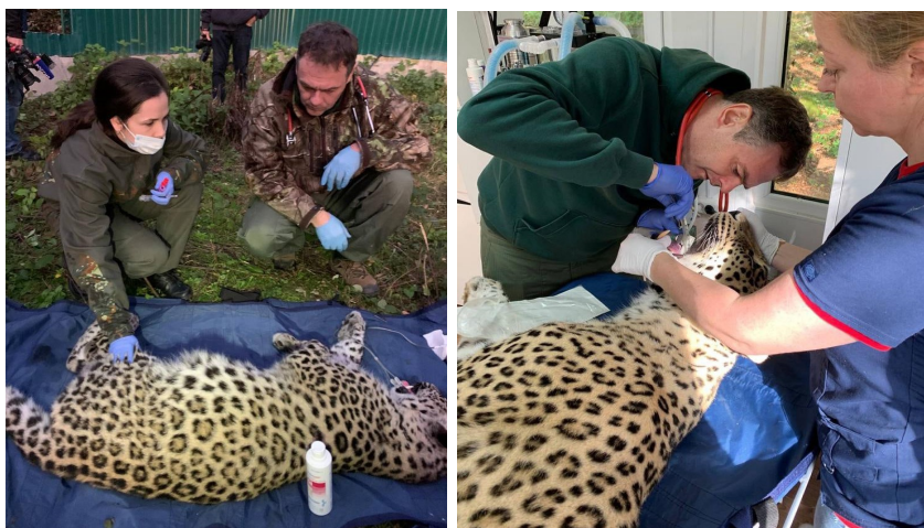
Рис. 1 Осмотр леопардов Рис.2. Стоматологическая операция. Леопард

Наши специалисты на постоянной основе осуществляют ветеринарное сопровождение деятельности «Центр по разведению переднеазиатского леопарда» Сочинского национального парка, направленной на восстановление популяции этого вида. В рамках этой деятельности необходимо проведение регулярных ветеринарных осмотров животных от момента их рождения и до выпуска в природу. 24 мая 2022г был проведен плановый ветеринарный осмотр леопардов (2 особи) , вакцинация. В ходе осмотра одного животного была выявлена необходимость в проведении стоматологической операции. Операция проведена. Животные перенесли анестезию без осложнений.